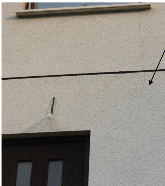
Pogled na poškodbe na SZ strani objekta