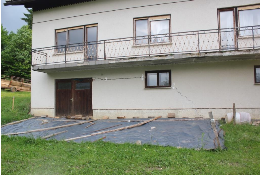
Pogled na močno poškodbo na JV strani objekta. Velikost razpoke do 15mm.